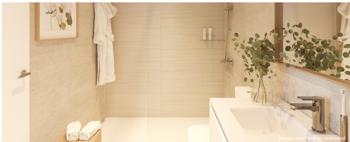
Imagen orientativa no contractual