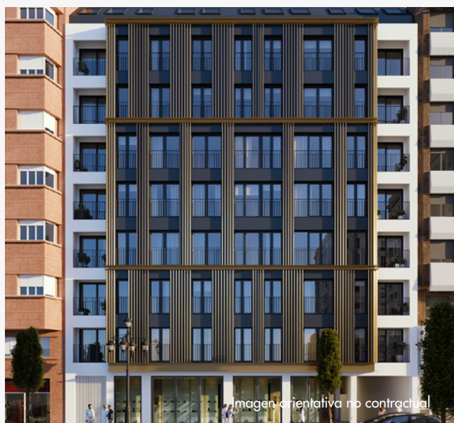
Imagen orientativa no contractual