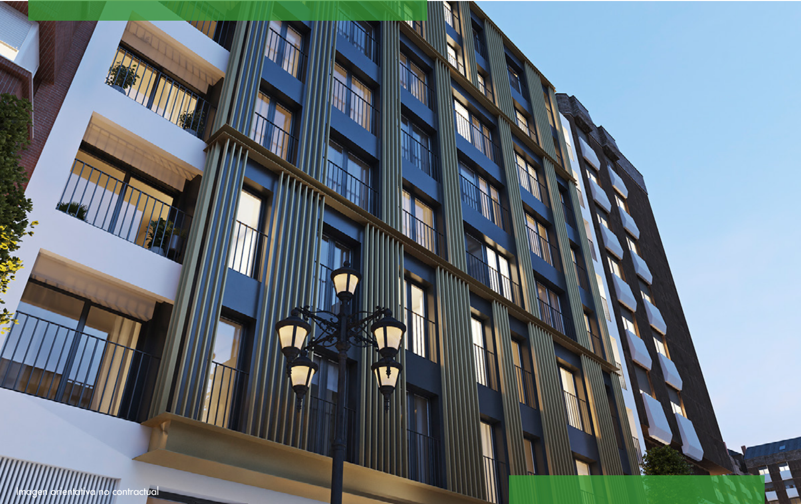
Imagen orientativa no contractual