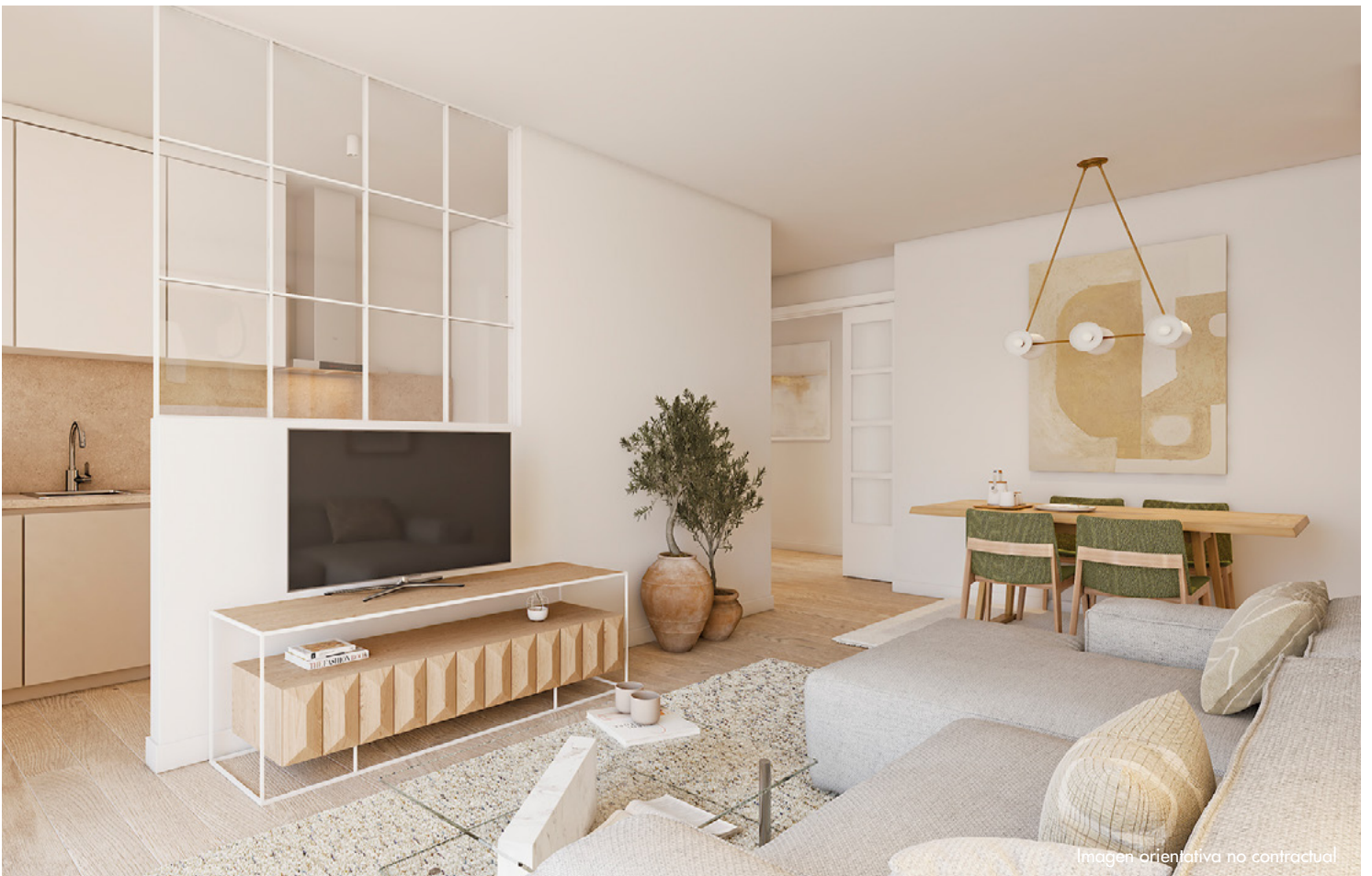
Imagen orientativa no contractual