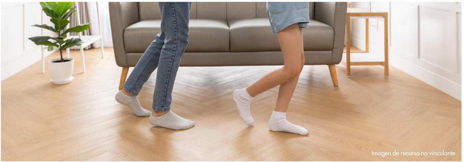
Imagen de recurso no vinculante