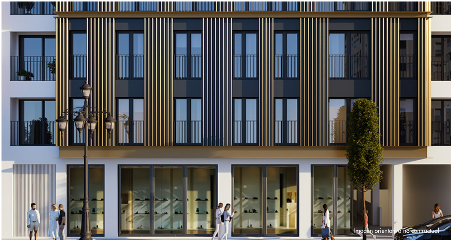
Imagen orientativa no contractual