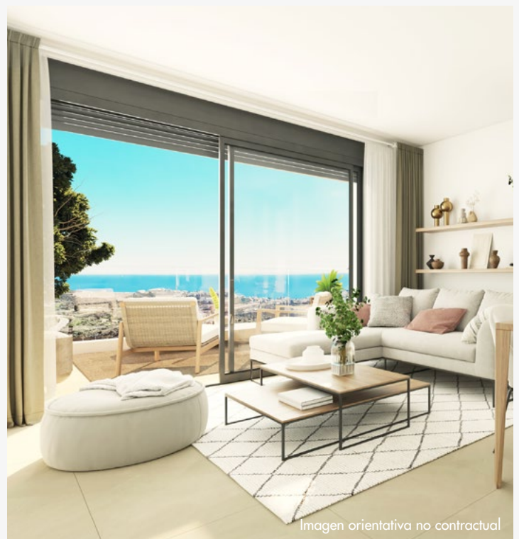
Imagen orientativa no contractual