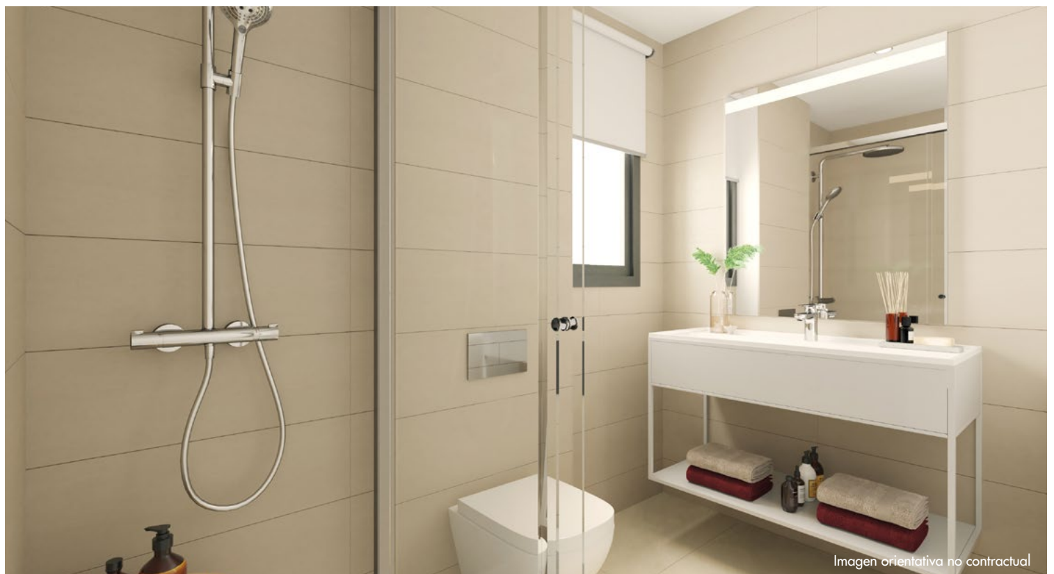
Imagen orientativa no contractual