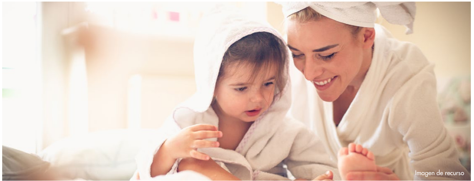
Imagen de recurso