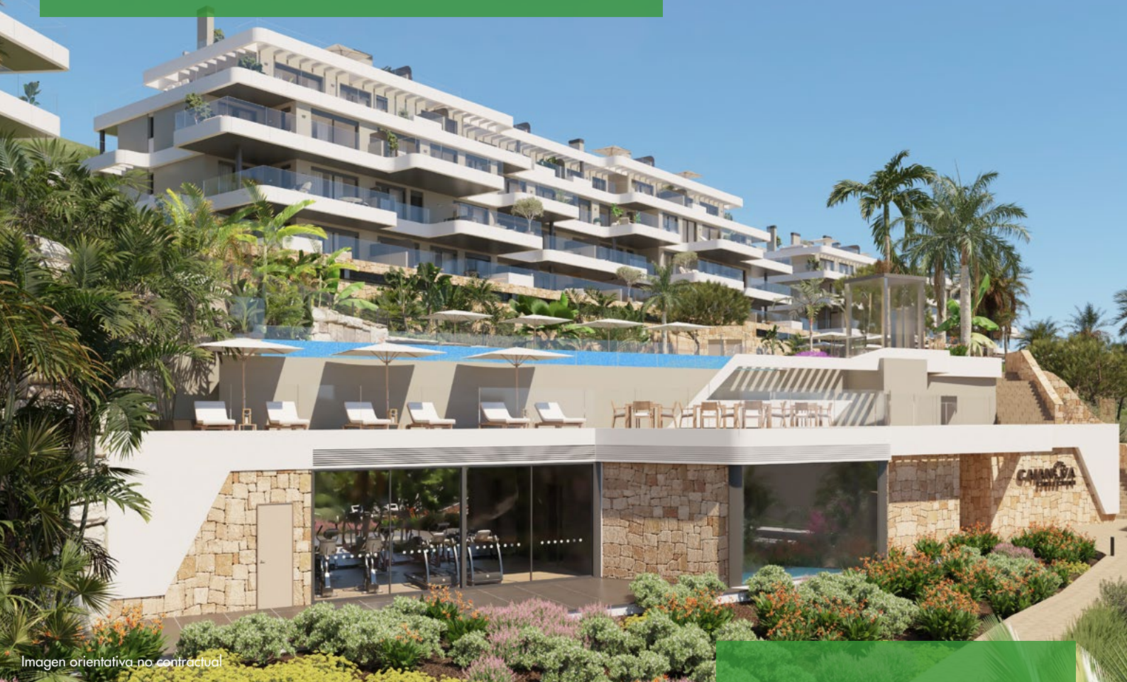
Imagen orientativa no contractual