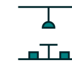
Espacio Club Social