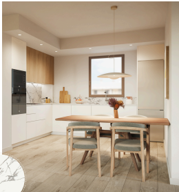
Model tauell i frontal de cuina