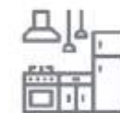
Acabado de cocina