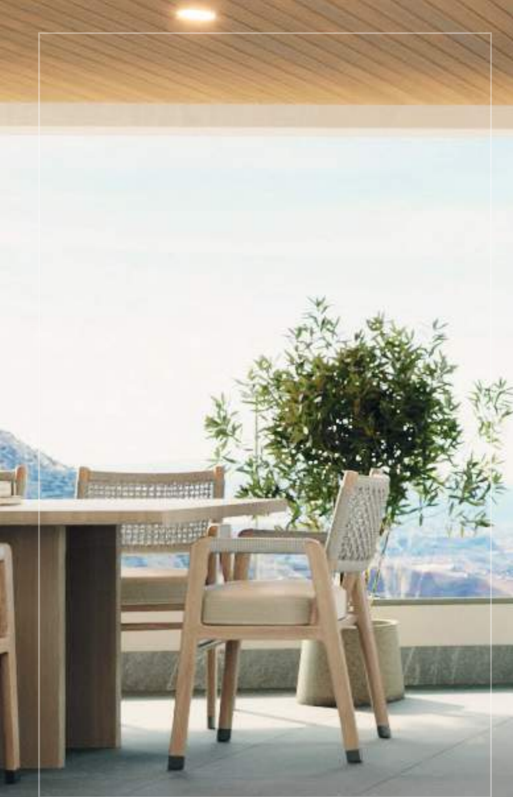
* Imágenes orientativas