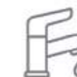
Acabado de baño