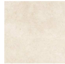
VELA NATURAL 59,6 cm x 59,6 cm ZOC. VELA NATURAL 9 cm x 59,6 cm Gres porcellanato rectificado

TERRAZAS: Solería de gres porcelánico Antideslizante 60*60cm modelo Vela Natural Antislip de Porcelanosa.