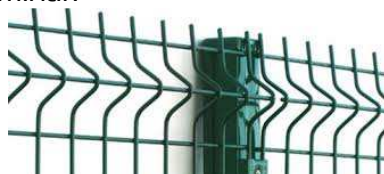
Imagen con carácter informativo, no se corresponde exactamente con este proyecto y carece de valor contractual

Malla elector soldada y plastificada con postes cada 2.50m y 1.00 - 1.50m de altura. Color por determinar.