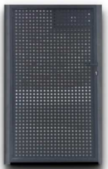
Imagen con carácter informativo, no se corresponde exactamente con este proyecto y carece de valor contractual

Abatible con electro cerradura marco con tubos de acero y paño central con chapa perforada, acabado de pintura esmalte.