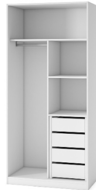
Imagen con carácter informativo, no se corresponde exactamente con este proyecto y carece de valor contractual

Revestimiento interior de tablero de melamina textura textil, con balda intermedia para maletero, barra de colgar y una cajonera integrada.