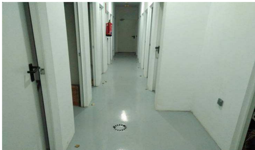
Imagen con carácter informativo, no se corresponde exactamente con este proyecto y carece de valor contractual.

Se sitúan parte en planta sótano de aparcamiento y parte en planta baja, los de planta baja se encuentran junto a la plaza de aparcamiento vinculada a la misma vivienda y los de planta baja con acceso desde corredor comunitario. Las divisiones se realizan con fábrica de ½ pie de ladrillo perforado, enfoscado con mortero y acabado con pintura plástica, instalación superficial de electricidad para toma de corriente y punto de luz individualizado (no comunitarios). Puerta de chapa galvanizada lacada color blanco con cerradura. Pavimento igual que el de zonas comunes.