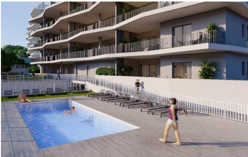
Imagen con carácter informativo, corresponde a este proyecto, pero puede verse modificado por razones técnicas o legales hasta su finalización, y carece de valor contractual

De vaso rectangular de hormigón armado in situ, medidas 10x4x1.5m de profundidad media, acabada con revestimiento vítreo de, con escaleras de acero inoxidable, equipada con sistema de filtración en caseta exterior y focos sub acuáticos, el recinto de piscina contará con aseos, recinto para almacenaje de productos químicos y equipos de limpieza y mantenimiento y duchas exteriores. La terminación del pavimento será combinando gres porcelánico antideslizante, hormigón impreso y zonas ajardinadas.