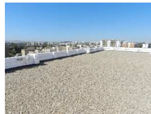
Imágenes con carácter informativo, no se corresponden con este proyecto y carecen de valor contractual

Terrazas privadas con pavimento de gres antideslizante modelo Vela Natural de Porcelanosa con barandilla de acero acabado esmaltado.