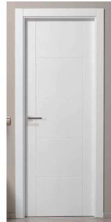
Imagen con carácter informativo, no se corresponde exactamente con este proyecto y carece de valor contractual

DM pantografiadas con cuarterones horizontales, galces de DM sobre premarco de madera de pino nacional. Herrajes de colgar y cierre en acero inoxidable mate, goma de cierre perimetral, tapajuntas de DM rectos de 9 cm. Puerta corredera con bastidor oculto en tabiquería con herrajes de deslizamiento y topes integrados