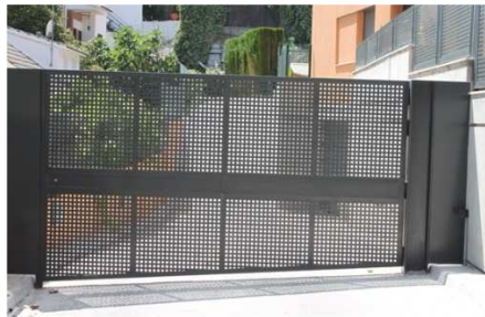
Imagen con carácter informativo, no se corresponde exactamente con este proyecto y carece de valor contractual

De una hoja abatible motorizada y mando a distancia con marco de tubular y paño central de chapa perforada acabado con pintura esmalte.