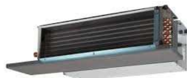
Imagen con carácter informativo, no se corresponde exactamente con este proyecto y carece de valor contractual