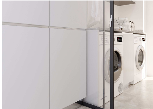
Imágenes con carácter informativo, no se corresponden con este proyecto y carecen de valor contractual

COCINAS: Con pavimento general de vivienda, con guarnecido de yeso maestreado vertical y horizontal y falsos techos de placas de yeso laminado, acabado con pintura plástica mate.