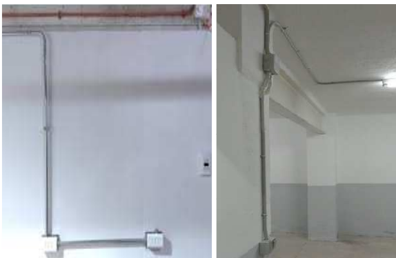
Imagen con carácter informativo, no se corresponde exactamente con este proyecto y carece de valor contractual

Preinstalación de toma de corriente independiente para carga de vehículo eléctrico en la plaza de aparcamiento.