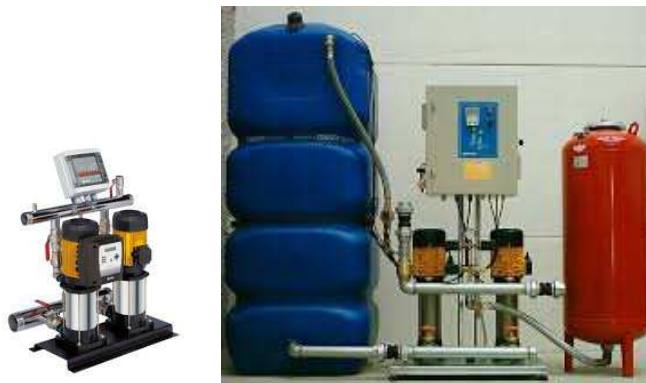
Imagen con carácter informativo, no se corresponde exactamente con este proyecto y carece de valor contractual

El edificio cuenta con un sistema de acumulación de agua y un grupo de presión comunitario que garantiza la reserva de agua potable.