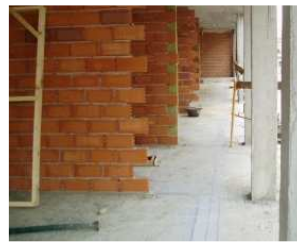
Imágenes con carácter informativo, no se corresponden con este proyecto y carecen de valor contractual