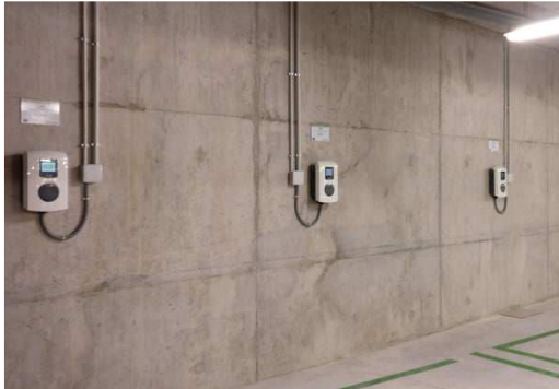
Imagen con carácter informativo, no se corresponde exactamente con este proyecto y carece de valor contractual. Solo se incluye la preinstalación, sin el equipo de cargador homologado.

Con acceso a través de puerta abatible motorizada, plazas abiertas, todo el recinto cuenta con sistema comunitario de detección y extinción de incendios, equipo de renovación de aire con detectores de CO 2 , iluminación Led y pre-instalación de toma de corriente individual para recarga de vehículo eléctrico.