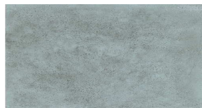
VELA GREY. 59,6 cm x 29,1 cm

Zócalo de azulejo Vela Gris en pasillos y portal de planta baja, resto de paramentos enfoscado de mortero o guarnecido de yeso acabado con pintura plástica mate.