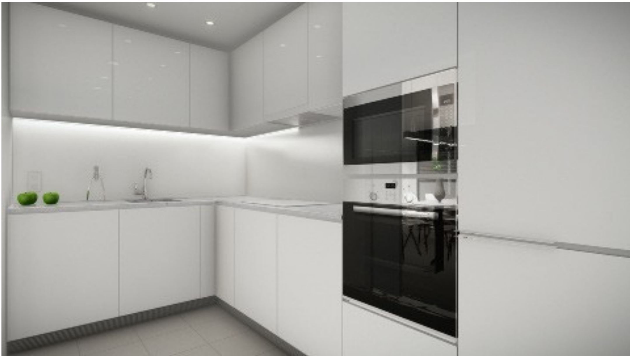
Diferents possibilitats d'acabats