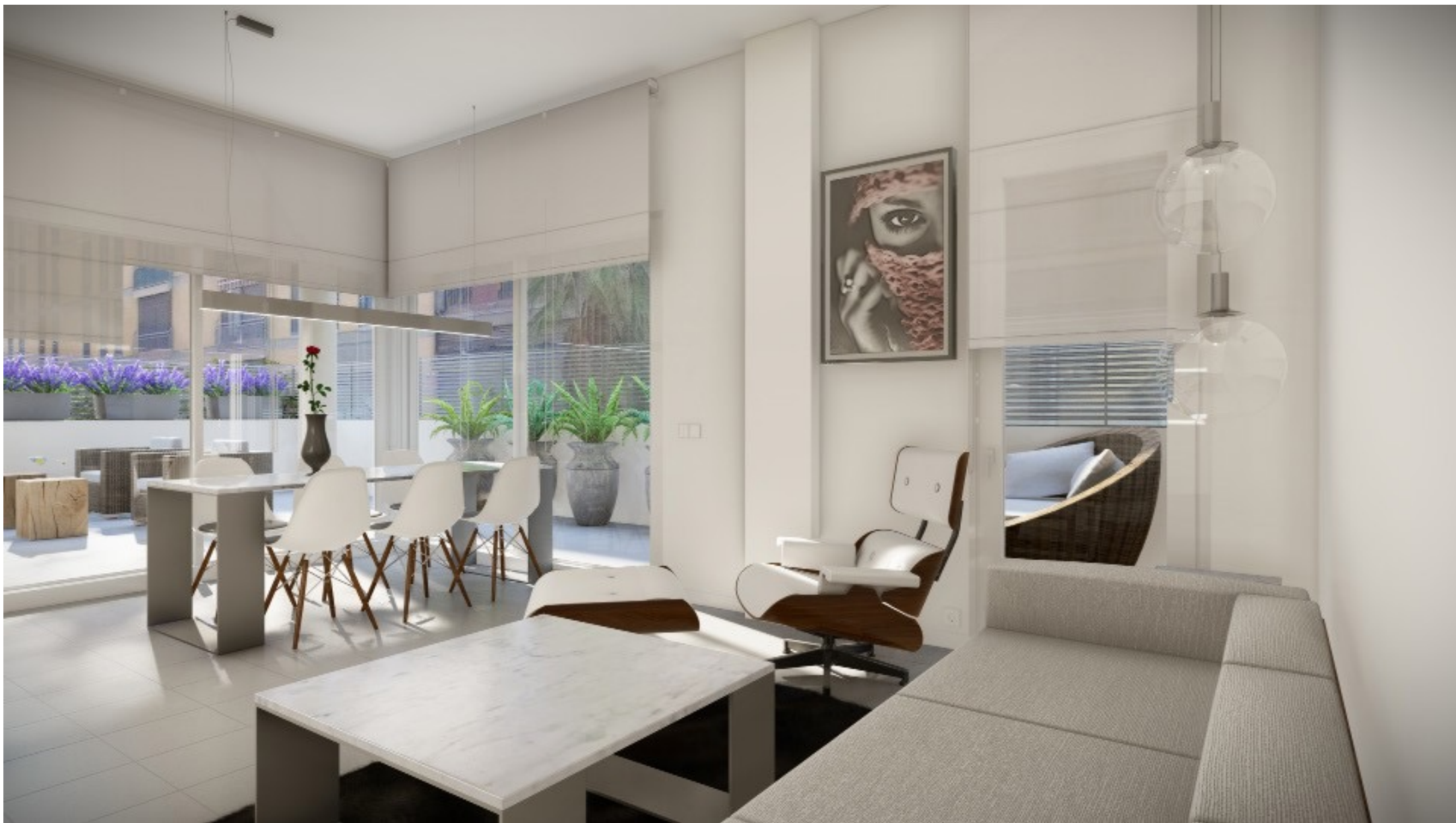
Interior de l'habitatge. Acabats