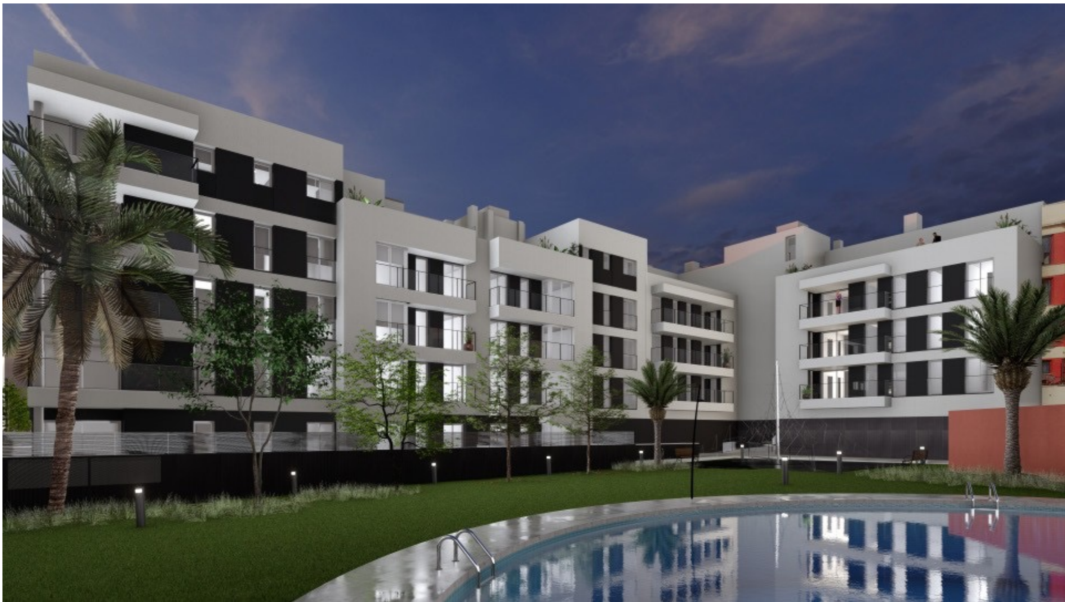
Urbanització i Zones Comunes. Vespre