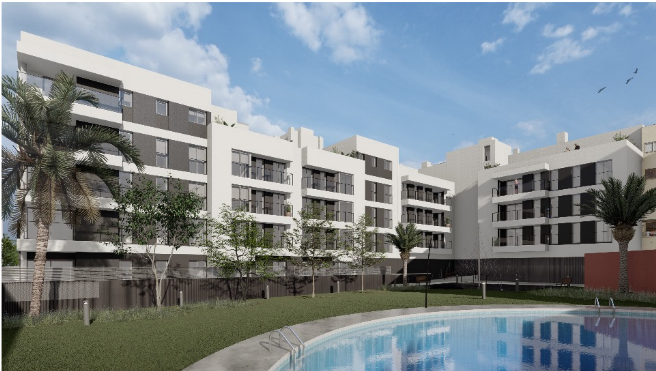
Urbanització i Zones Comunes