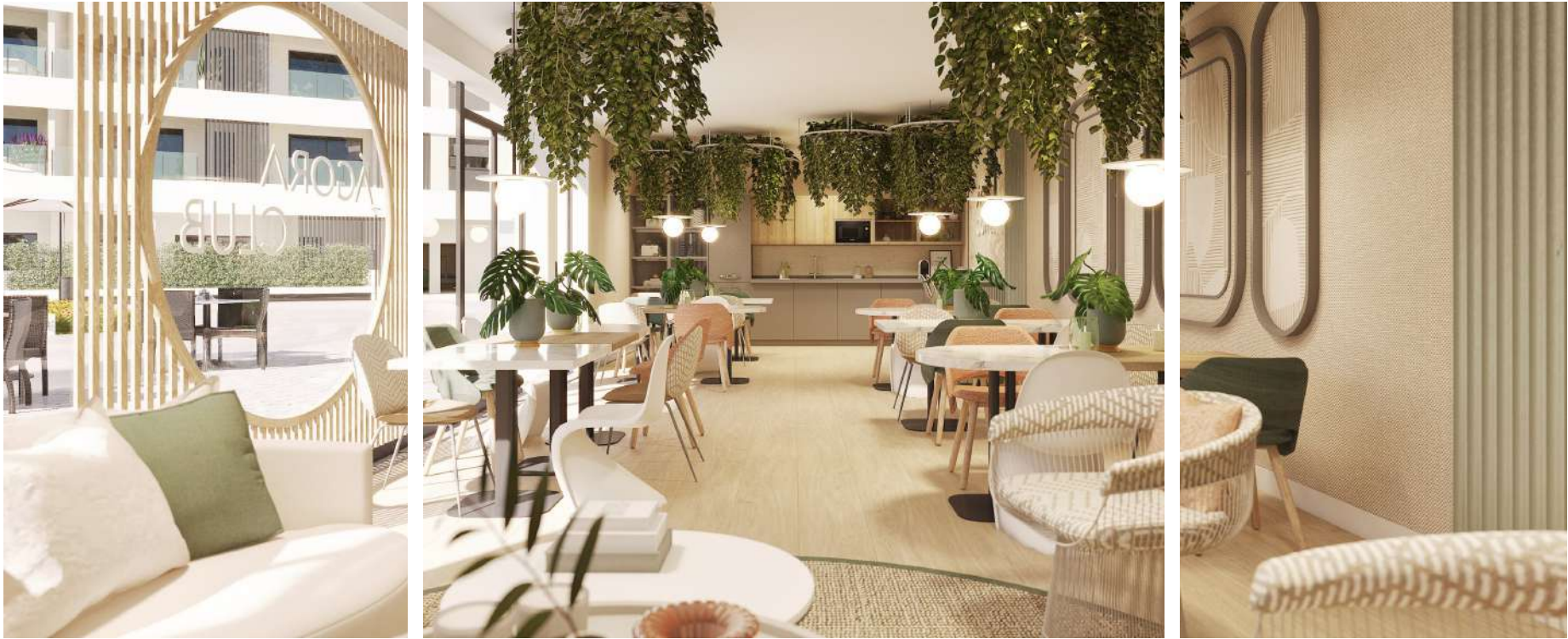
ÁGORA CLUB Modelo Salón Gourmet.