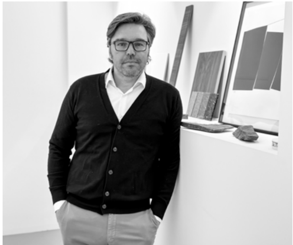
Víctor García Martínez Arquitectos

Materialmente los edificios se resuelven con una precisión y lógica constructiva actual y sostenible, pero manteniendo lazos con las preexistencias del lugar. Lo vinculan cromáticamente con la casa rural y con los recursos propios de la arquitectura tradicional y vernácula, como la utilización de lamas correderas con función de filtro solar.