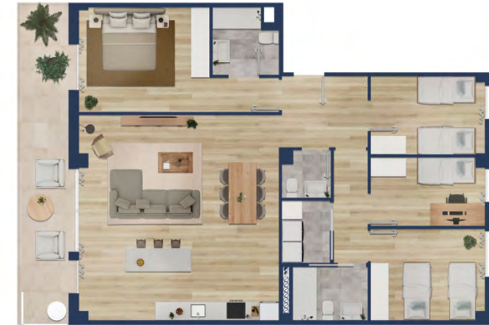
Vivienda tipo 4D

Superficie útil interior: 72 m 2 Superficie exterior: 7 m 2