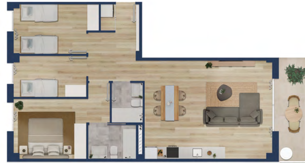
Vivienda tipo 3D

Superficie útil interior: 54 m 2 Superficie exterior: 14 m 2