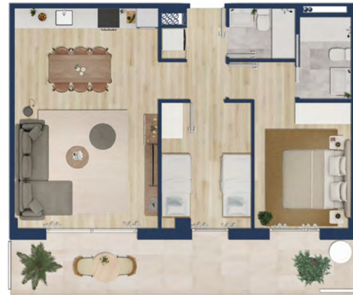
Vivienda tipo 2D

Superficie útil interior: 54 m 2 Superficie exterior: 14 m 2