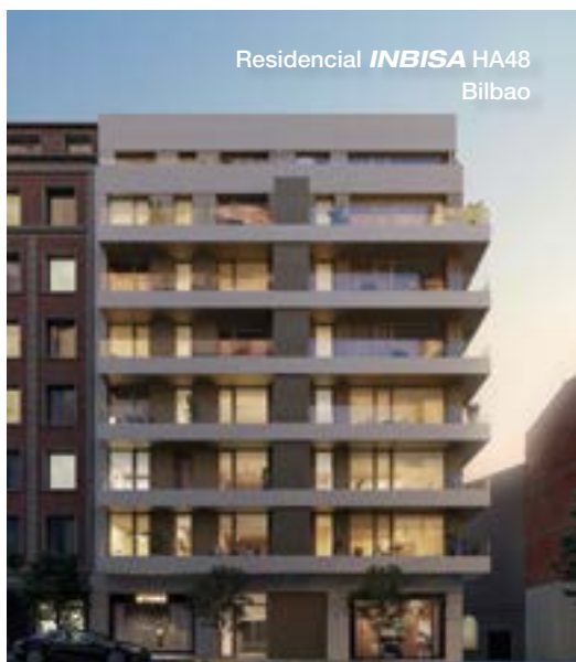
Residencial INBISA HA48 Bilbao