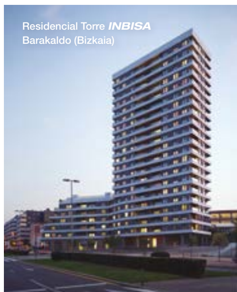
Residencial Torre INBISA Barakaldo (Bizkaia)