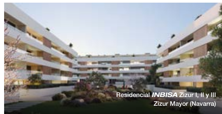
Residencial INBISA Zizur I, II y III Zizur Mayor (Navarra)