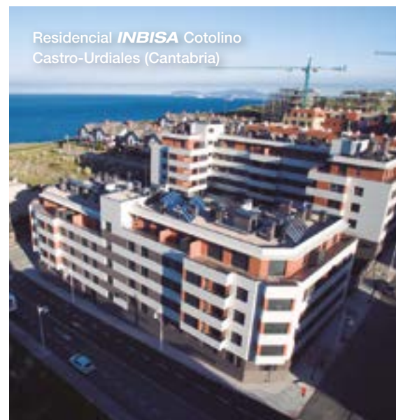
Residencial INBISA Coto lino Castro-Urdiales (Cantabria)