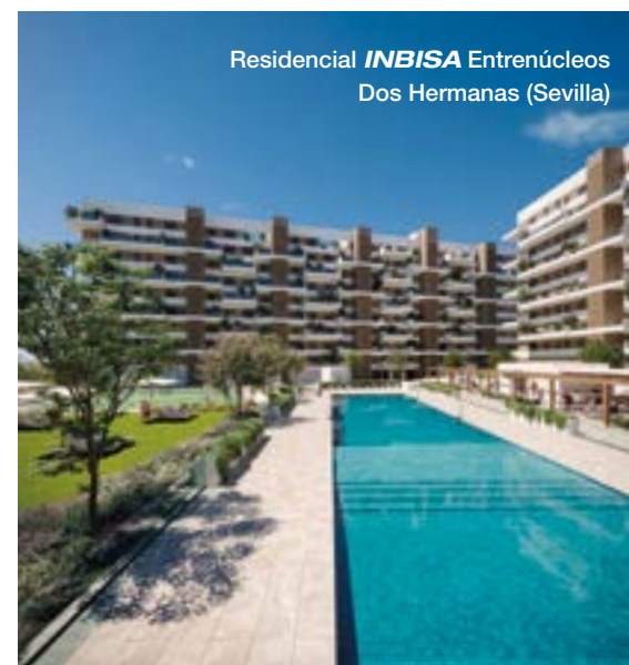
Residencial INBISA Entrenúcleos Dos Hermanas (Sevilla)