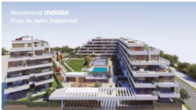
Residencial INBISA Pinar de Jalón (Valladolid)