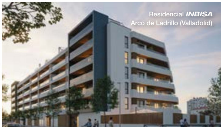
Residencial INBISA Arco de Ladrillo (Valladolid)