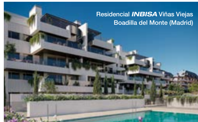
Residencial INBISA Viñas Viejas Boadilla del Monte (Madrid)