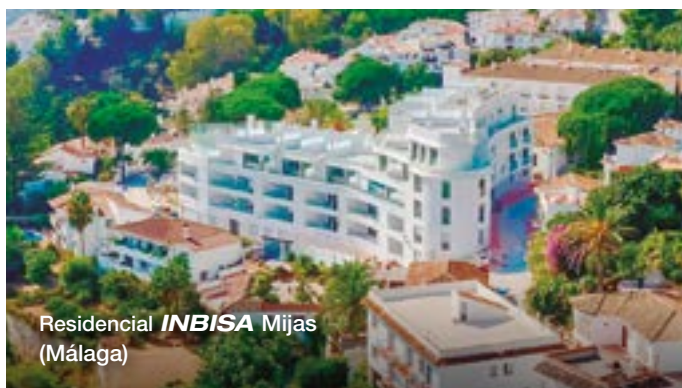
Residencial INBISA Mijas (Málaga)