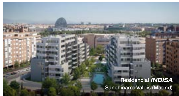
Residencial INBISA Sanchinarro Valois (Madrid)