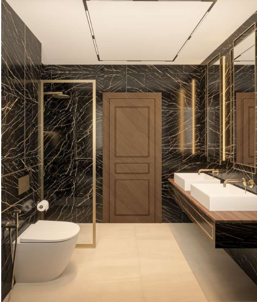
BAÑO PRINCIPAL 3B