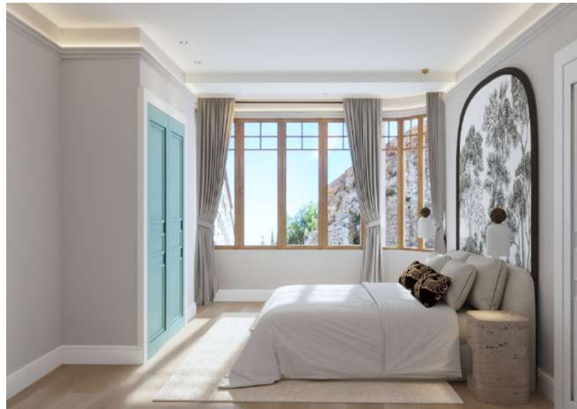
INTERIOR DE LA VIVIENDA . 1B

En planta baja y en áticos con terraza las persianas serán de seguridad.