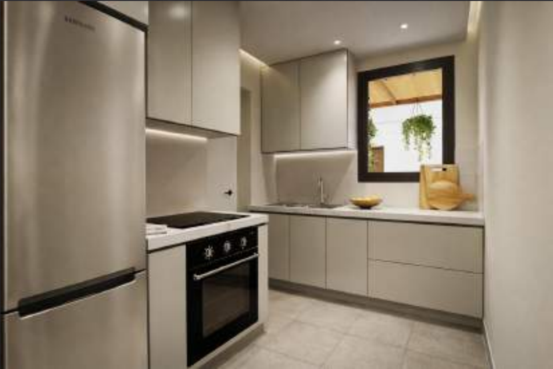
Cocina no incluida en el precio