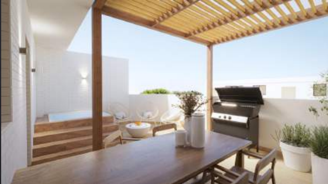
Jacuzzi opcional bajo petición