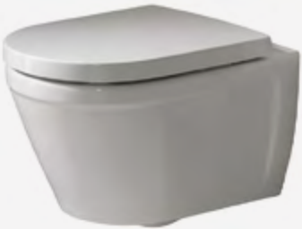
Set inodoro suspendido y asiento con bisagra amortiguada.