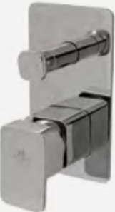
Monomando de ducha.