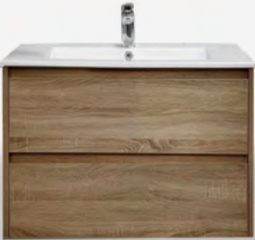
Encimera con lavabo, 80 x 1,2 x 53 cm