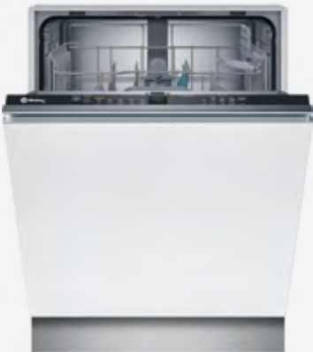
Lavavajillas integrable 60 cm