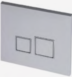
Placa de accionamiento con doble pulsador.