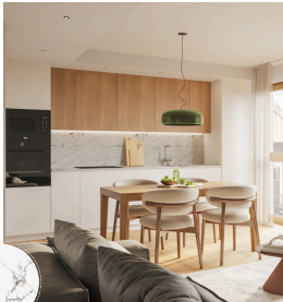
Model taulell i frontal de cuina

Aigüera d'acer inoxidable de sota taulell.