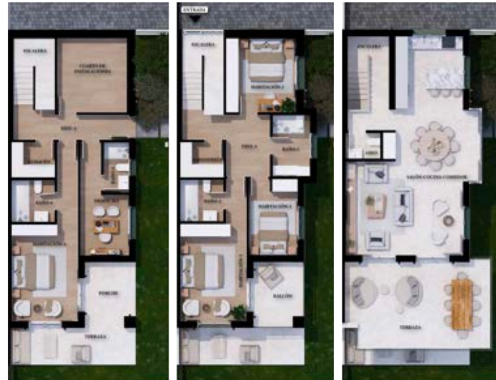
PLANTA PRIMERA PLANTA BAJA PLANTA SÓTANO