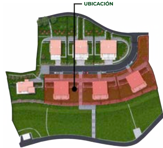
VIVIENDA PAREADA 3 VIVIENDA 9C (9B, 9D, 9E, 9F, 9G)