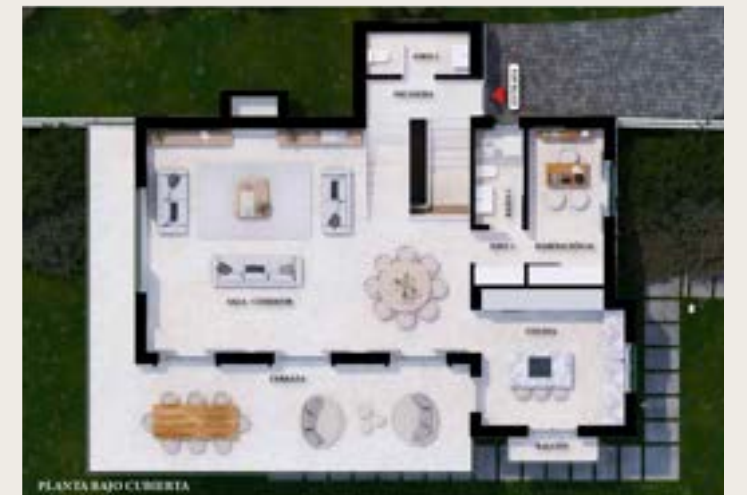
PLANTA BAJO CUBIERTA