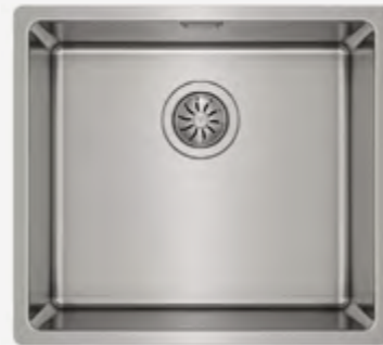
Fregadero de acero inoxidable para bajo encimera de una cubeta.