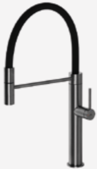
Grifo en monomando y caño alto extraíble de gran resistencia.