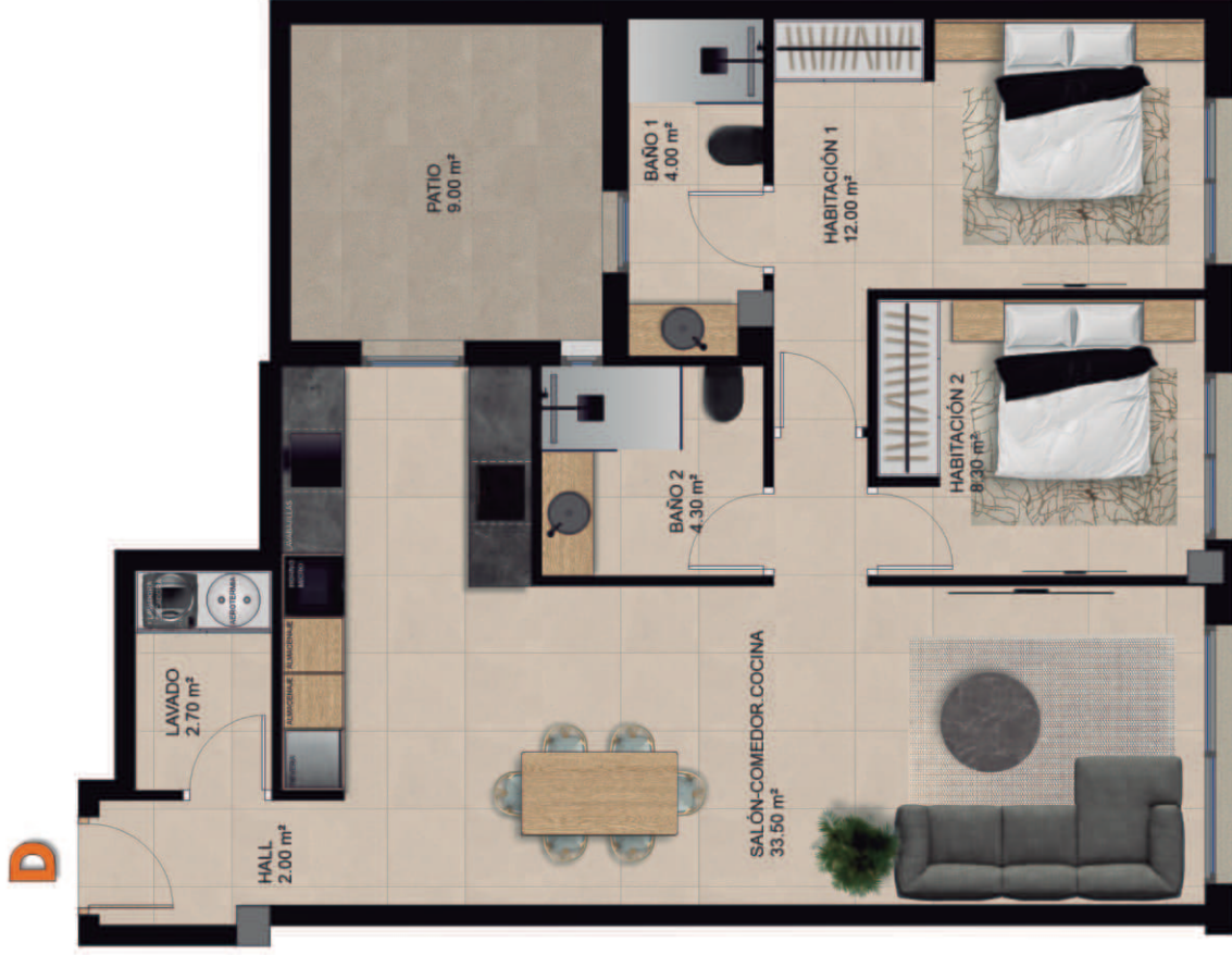
Vivienda D Superficie CONSTRUIDA 84.70 m 2