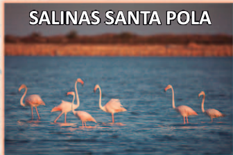
SALINAS SANTA POLA