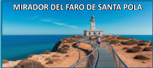
MIRADOR DEL FARO DE SANTA POLA

BARS & RESTAURANTS 1 min. SUPERMARKET 2 min. GOLF 20 min. PLAYAS / BEACH 20 min. HOSPITAL 20 min. AEROPUERTO / AIRPORT 20 min.