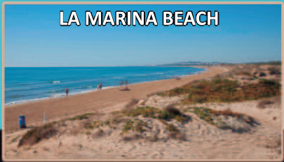
LA MARINA BEACH