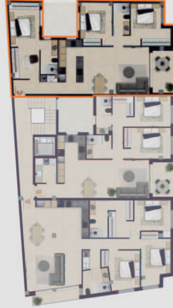
PLANTA PISO 1 Y 2