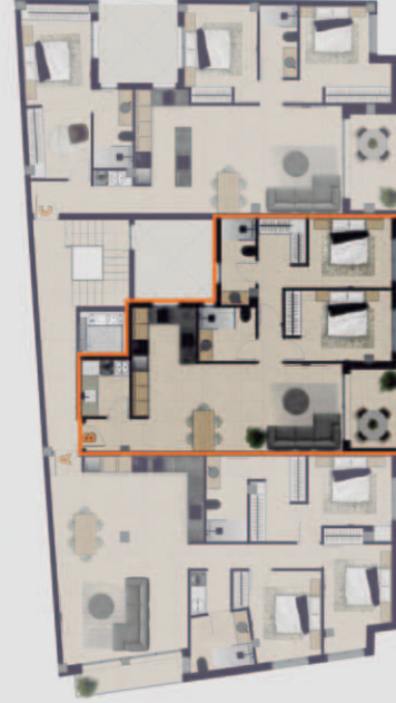
PLANTA PISO 1 Y 2