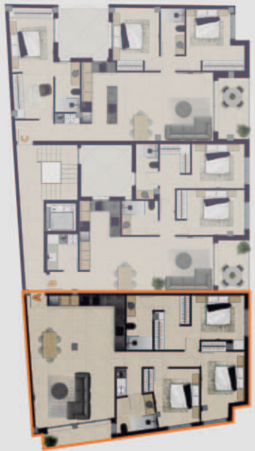
PLANTA PISO 1 y 2