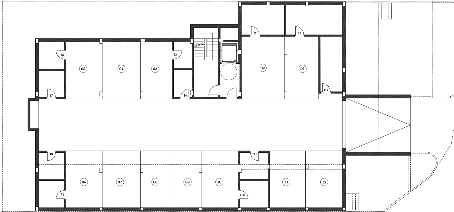
PLANTA SÓTANO ESCALA: 1/100