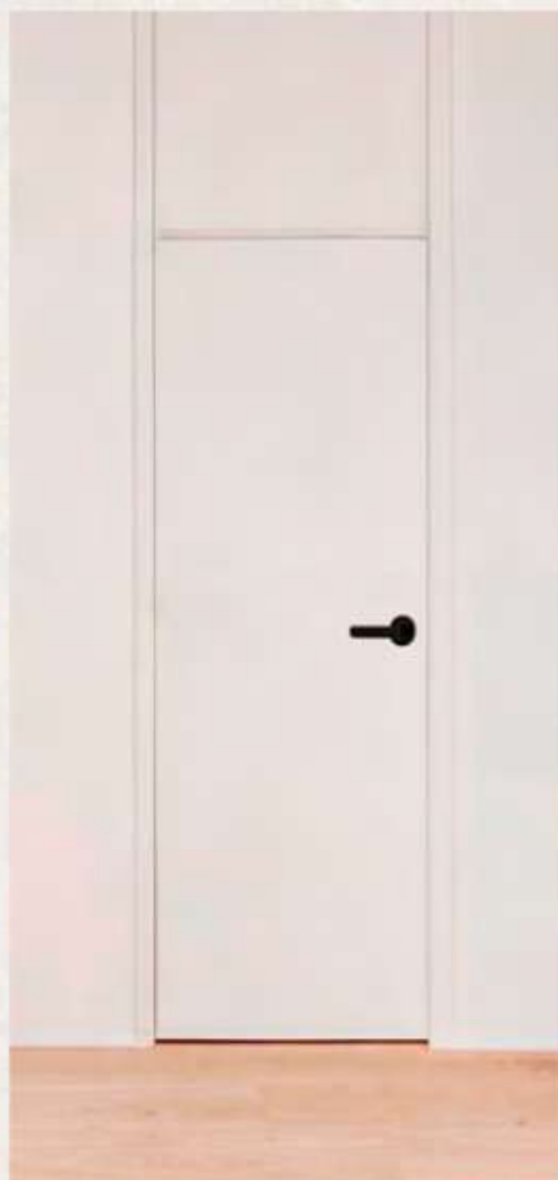
Puertas de paso